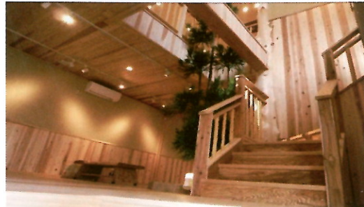
自然素材と環境に配慮した工法による「創造空間～Creative Office～」